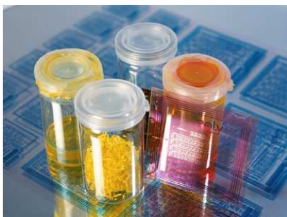
Bildquelle: PolyIC GmbH & Co. KG Polymere Materialien

Die Unternehmen PolyIC, BASF, Evonik Industries, Elantas Beck und Siemens haben ein vom Bundesministerium für Bildung und Forschung (BMBF) gefördertes Verbundprojekt mit dem Namen „MaDriX“ gestartet. Mit diesem Projekt wird die Entwicklung leistungsfähigerer gedruckter Funketiketten (Radio Frequency Identification, RFID) für die Kennzeichnung preiswerterer Konsumgüter vorangetrieben.